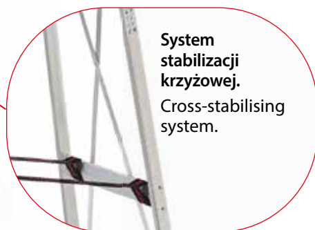
System stabilizacji krzyżowej. Cross-stabilising system.