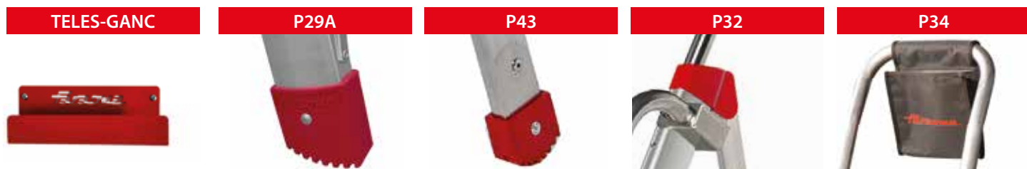
Wieszak na ścianę do drabiny. Wall hanger to ladder.