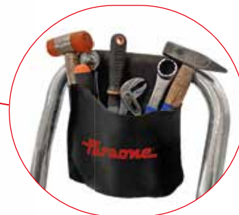
Praktyczna torba na narzędzia. Practical tool bag.