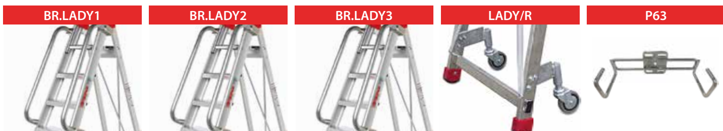
Poręcze drabiny Lady/Sdomus 06-08. Handrails Lady/Sdomus 06-08.